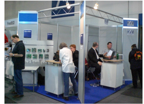
Da sollte der Mandrivastand sein!

Ein weiteres Zeichen der Dominanz des Unternehmensbereiches auf dem Linuxtag, aber auch der Akzeptanz von Linux im Unternehmen sowie eine Betonung der internationalen Bedeutung des Linuxtages war der „Französische Pavillon“, ein Schwerpunkt der diesjährigen Messe. In einem sehr schön gestalteten Bereich (siehe Bild links) präsentierten sich ca. 20 französische Linuxfirmen unter der organisatori-