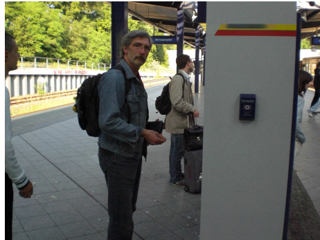
Magnus auf dem Weg...

Alleine dafür hat es sich für mich gelohnt. Außerdem natürlich ein paar Bekannte von vorangegangenen Linuxtagen in Berlin getroffen. Überall mal reingeschnüffelt, allerdings fehlte mir da so der Heimatstand, wir