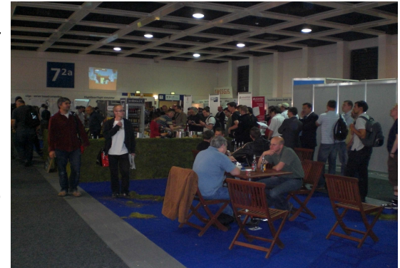
Catering statt Projektstände

Überhaupt konnte man den in den letzten Jahren sicher auch schon stattfindenden Wandel in der allgemeinen Struktur der Ausstellung noch nie so deutlich erkennen wie im Jahr 2009. Die Messe war eindeutig vom Business bestimmt. Das war auch früher schon so, nur wurde früher der Businessanteil von großen Unternehmen dominiert, die in 2009