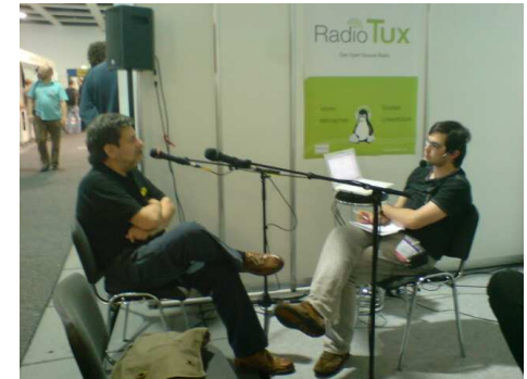
Interview bei Radio Tux