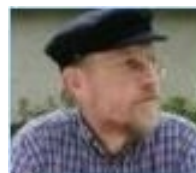
Manfred aka Windhund